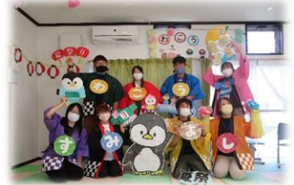
ありがとうございました!