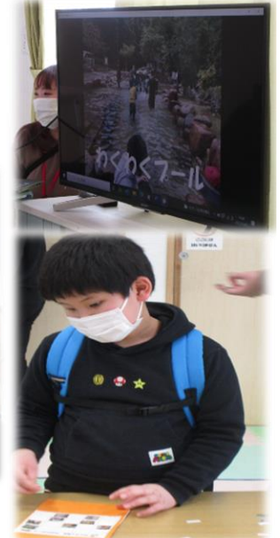
2022年度も、色々なことにチャレンジしていこうね(/・ω・)/