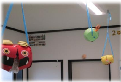
割れると中からご褒美が☆