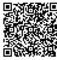
ホームページQRコード

長いようで短かった夏休みが終わりました。持ち物のご協力ありがとうございました。行事などの中でお子さんが、成長し、考えて行動している姿を見ることもでき、ずいぶん励まされました。2学期もよろしくお願ひいたします！！ 2020/9/17