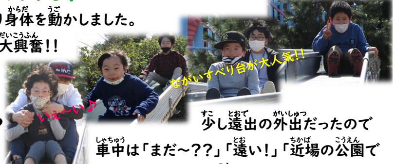
ながいすべり台が大人気!!

かなりの高所ですが、頑張って登って滑った子も(∩) / 新たな挑戦と一緒に出来たこと。とても嬉しかったなあ~♡